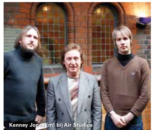
Kenney Jones (m) bij Air Studios

sen. Hij had een prachtige melodische stijl. Toen we samen met Steve Small Faces oprichtten, konden we nauwelijks echt spelen, maar er was meteen een klik. Ik volgde als drummer juist het ritme van de gitaar van Steve, terwijl Ronnie zijn ding deed. Ronnie had een vrije "zigeunergeest", was