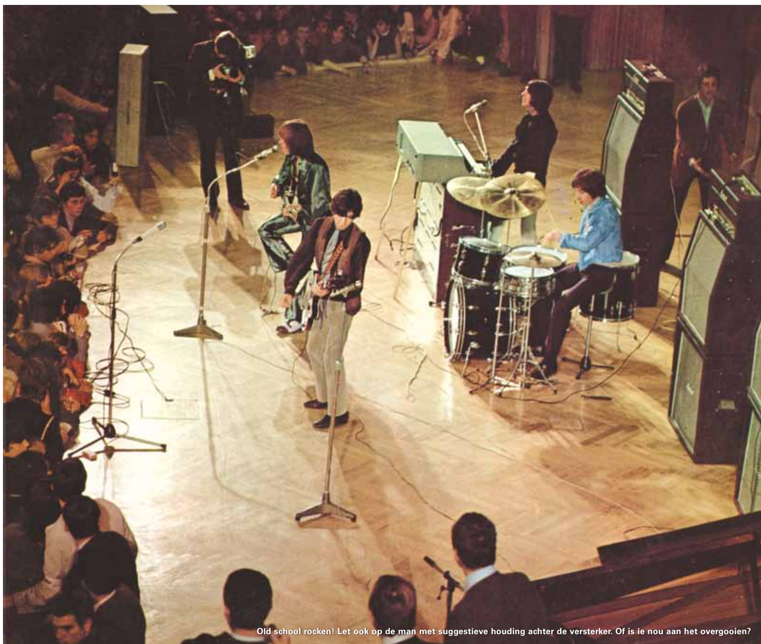
Old school rocken! Let ook op de man met suggestieve houding achter de versterker. Of is ie nou aan het overgooien?

een diepe denker en vooral een goede vriend. Ik mis hem nog iedere dag, maar ik weet dat hij altijd wel bij me is.'